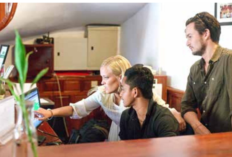
Nytt datasystem i resepsjonen; her gjelder det å øve til det sitter.