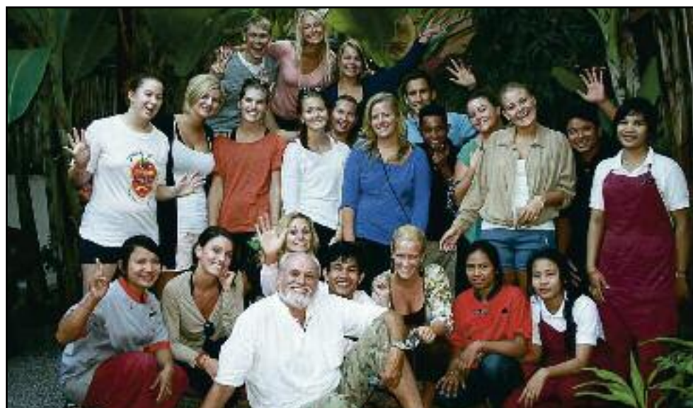
Skolegjengen. Her er fjorårets studenter fra Norge samlet til fellesbilde inne på Babel gjestehus.